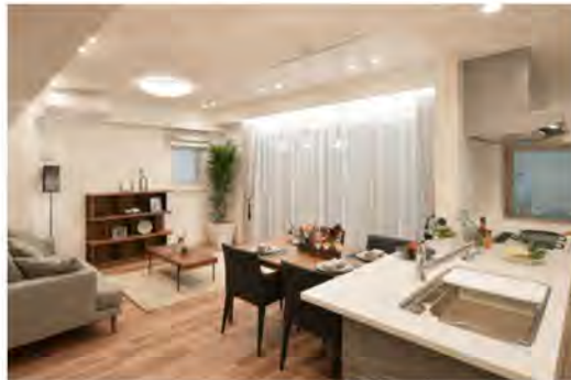
●リビングルームのフローリング床、建具のカラーを選べます。

※掲載写真は当社施工例(2018.11月撮影)。一部オプションが含まれている他、家具・備品等は配置例を示したもので販売価格には含まれません。