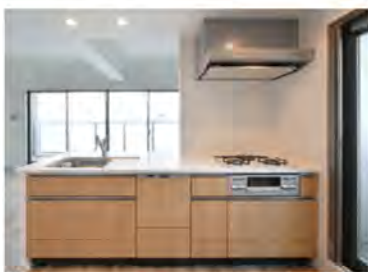
●キッチンのカラーを選べます。