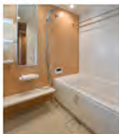
●浴室、洗面化粧台のカラーを選べます。

■物件概要 ●名称/ロフト多治見駅前II ●所在地/岐阜県多治見市白山町1丁目56番1・56番3・57番1・58番・59番・60番 ●交通/JR多治見駅 徒歩4分 ●用途地域/商業地域・防火指定なし・22条地域・駐車場整備地区・第1種特別工業地区・景観区域 ●地目/宅地 ●建ぺい率・容積率/80%/400% ●敷地面積/826.93m 2 (敷地全体) - 48.96m 2 =777.97m 2 (建築基準法上の有効敷地面積) ●建築面積/442.59m 2 ●延床面積/4,201.88m 2 ●エレベーター/13人乗り1基 ●総戸数/39戸 ●分譲後の敷地の権利形態/敷地は専有面積割合による区分所有者の共有 ●分譲後の建物の権利形態/区分所有 ●管理形態/区分者全員による管理組合を結成し、管理会社に委託 ●構造・規模/鉄筋コンクリート造14階建 ●第H30確認建築CI東海G00100号(平成30年11月20日) ●駐車場/40台(タワーパーキング34台・平置5台・来客用1台) ●駐輪場/約54台(ラック式38台・平置16台) ●バイク置場/2台 ●間取り/3LDK ●住居専有面積/70.00m 2 ~82.46m 2 ●バルコニー面積/13.30m 2 ~21.21m 2 ●アルコーブ面積/3.50m 2 ~7.80m 2 ●建物完成予定/2020年3月末 ●入居予定/2020年4月末 ●先行販売の概要 ●販売戸数/8戸 ●間取り/3LDK ●販売価格(税込)/2,790万円~3,780万円 ●管理費(月額)/9,900円~11,700円 ●修繕積立金(月額)/4,100円~4,800円 ●修繕積立基金(入居時一括)/168,300円~198,900円 ●管理組合設立準備基金(入居時一括)/29,700円~35,100円 ●駐車場使用料(月額)/7,000円(タワーパーキング)~13,000円(屋内) ●バイク置場使用料(月額・台)/1,000円 ●自転車置場使用料/無料 ●売主/株式会社富士不動産 ●管理会社/株式会社菱サピルウェア中部支店 ●設計・監理/株式会社日伸設計事務所 ●施工/株式会社妻島建設 ●設計図書閲覧場所/株式会社富士不動産及びロフト多治見駅前IIマンションギャラリー ●広告制作年月日/2019年7月30日 ●広告有効期限/2019年8月末日